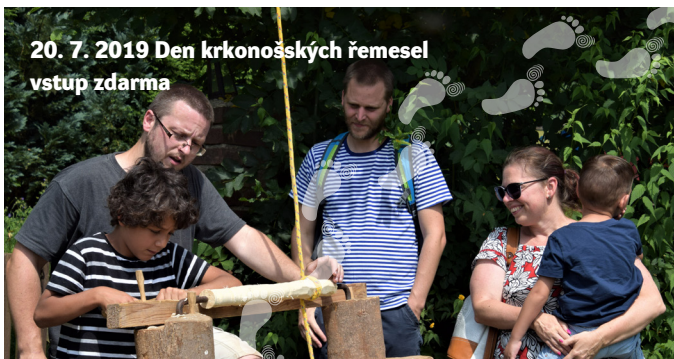
20. 7. 2019 Den krkonošských řemesel vstup zdarma

6 DŮM POD JASANEM www.dumpodjasanem.cz , Trutnov-Voletiny tel: 736 275 025